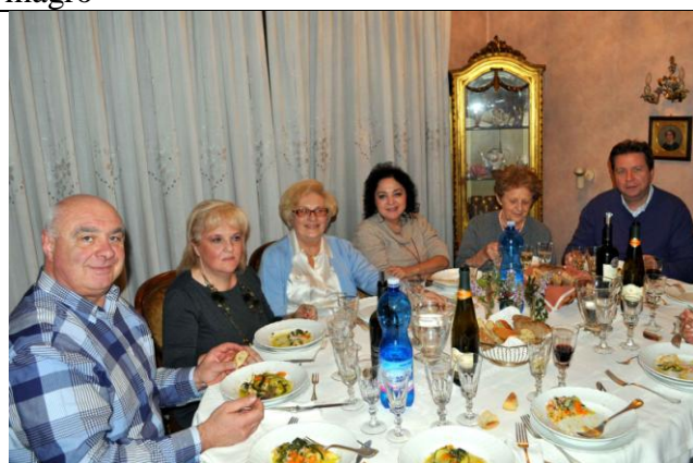
Indovinate perché sono così soddisfatti !!